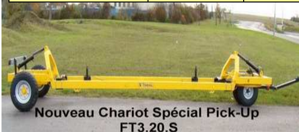
Nouveau Chariot Spécial Pick-Up FT3.20.S

Roue de secours 300 € Treuil pour atteler seul 250 €